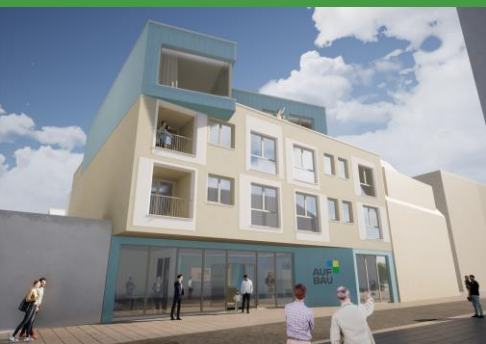
Vorderansicht aus Gotthardstraße

In den vergangenen Wochen wuchs der Neubau peu à peu und erreichte mit Vollendung des 3. Obergeschosses seine endgültige Höhe. Besonders imposant war zweifelsohne die Errichtung des ZOLLINGERDACHES. Hierbei wurden die einzelnen Dachsparren „scheibchenweise“ aufgerichtet, um die berühmte Dachform zu kreieren. Wir können nun die frohe Botschaft verkünden: der Rohbau ist abgeschlossen.