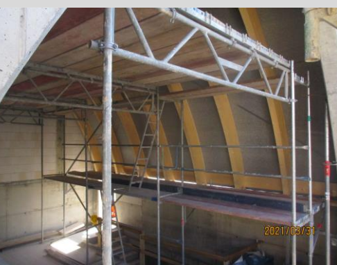
ZOLLINGERDACH von Innen

https://wg-aufbau-merseburg.de/service/downloads/